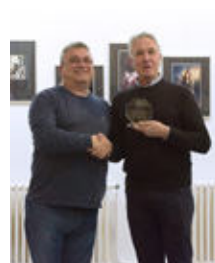
Josep M a Berenguer Millor Fotografia