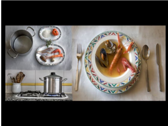
4. Salvador Berdajín